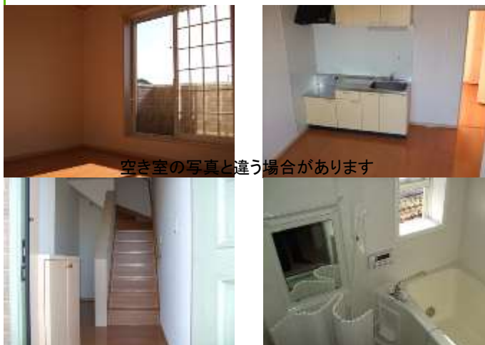
空き室の写真と違う場合があります