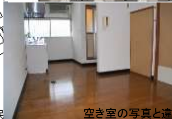
空き室の写真と違う場合があります