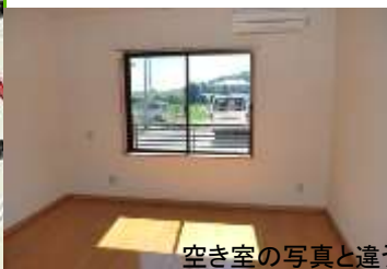
空き室の写真と違う場合があります